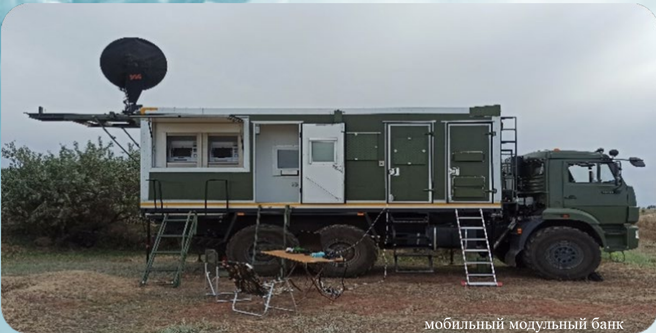
мобильный модульный банк