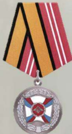
МЕДАЛЬ "ЗА УКРЕПЛЕНИЕ БОЕВОГО СОДРУЖЕСТВА"