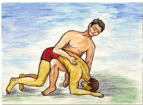
Удаление воды из дыхательных путей утопавшего.